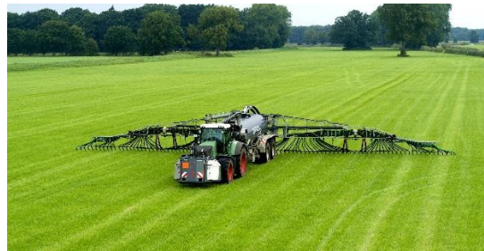
Afbeelding 4: Vogelsang heeft het ontwerp van het SyreN-systeem geoptimaliseerd op het gebied van veiligheid.