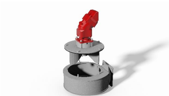
Afbeelding 5: PowerFill Small is de compacte vulhulp voor tankwagens met een vacuümsysteem.