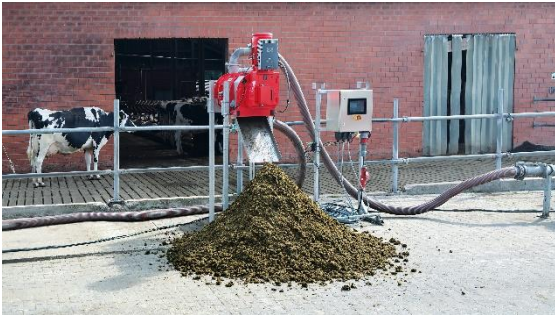
Afbeelding 1: Vogelsang presenteert de nieuwe schroefpers-mestscheider XSplit, die een drogestofgehalte tot 40 procent haalt.