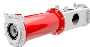
Afbeelding 6: De ProCap T excentrische wormpomp voor de tankwagen maakt het pompportfolio compleet.