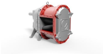
Pompa VX in alluminio

Vogelsang a Fieragricola, 31 gennaio – 3 febbraio 2018, Veronafiere padiglione 2, stand D7