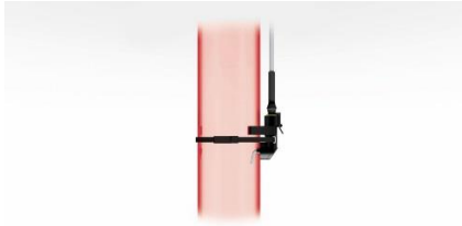
Sensore di flusso Flow Performance Monitor - FPM