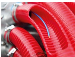
Sensore di flusso Flow Performance Monitor – FPM