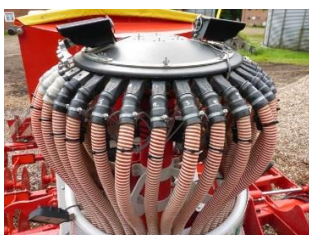
Sensore di flusso Flow Performance Monitor – FPM