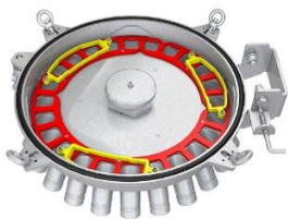
Nuovo Dosimat DMX- vista interna dall'alto